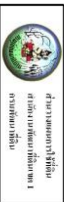
รูปที่ 3-3 แผนที่ผังอาคารใช้ที่ดิน ตำบลกรังเือง อำเภอบ้านฉาง จังหวัดนครนายก